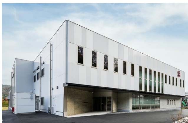
新社屋（本社事務所・イノベーションセンター）

2023年12月25日には取引先・関係者等を招き竣工式を執り行いましたので、お知らせいたします。