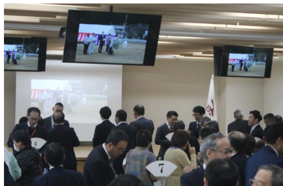
竣工パーティーの様子

50 年を迎えた歴史ある会社であり、人々の健康志向に応えるサプリメントを始め、人が元気に生きていくために必要な商品を提供していただけそうで、益々、備前化成の将来に期待が高まっております。